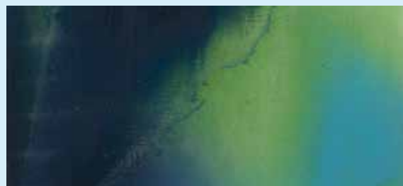
Marcelle Loubchansky, Moby Dick. (1956) Huile sur toile Collection du musée des beaux-arts de Brest